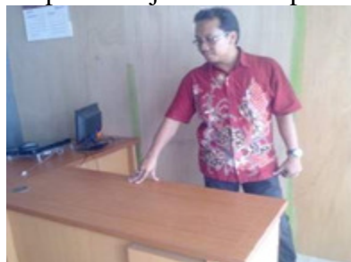
Gambar 3. Hasil Kerja Praktek

Evaluasi dilakukan untuk mengetahui kemampuan peserta pelatihan dilakukan dengan cara tanya jawab tentang gambar kerja dan pengamatan hasil karya atau produk yang dihasilkan oleh masing masing tukang dari segi ketepatan ukuran, pemilihan alat dan bahan, kecepatan kerja serta kerapihan hasil karya.