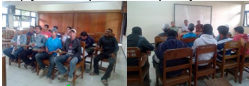
Gambar 1. Penyampaian Materi

Kegiatan pendidikan dan pelatihan life skill dimulai dengan memberikan pengetahuan umum yang berkaitan dengan peluang usaha meubel dan interior, permodalan, mencari konsumen pasar dan pentingnya kemandirian dengan berwirausaha (Gambar 1). Kemudian hari berikutnya masuk ke teknis dimulai dengan pengetahuan tentang pembacaan gambar kerja, pengenalan dan pengetahuan alat dan bahan, membuat pola dan praktek pembuatan meubel dan interior (Gambar 2). Sedangkan hasil kerja pembuatan meja dan kursi ditunjukkan pada Gambar 3.