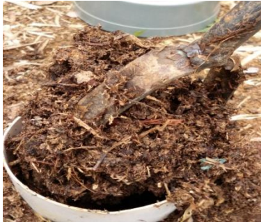
Gambar 9. Pupuk dari LRB

kemarau tidak kekeringan. Sehingga kondisi tanah menjadi lebih subur. Berikut hasil produk lubang resapan biopori yang telah diperoleh Gambar 9. Pupuk dari LRB