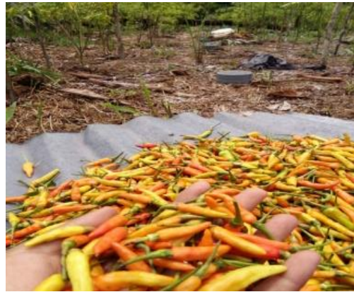
Gambar 10. Hasil panen cabai

Perubahan yang bisa diamati pada hasil analisis peningkatan hasil panen warga yaitu tanaman cabai di Desa Beringin Jaya Kecamatan Rupit karena siklus pertumbuhan cabai yang relatif lebih cepat dibandingkan dengan tanaman jeruk. Dari data pengabdian diperoleh hasil bahwa pada tahun 2016 informasi dari Bapak Heppi bahwa hasil panen cabai yang diperoleh pada tahun 2016 adalah sebesar 220 Kg. Kemudian pada awal tahun 2017 yaitu 230 Kg dan terakhir setelah penerapan teknologi Lubang resapan biopori serta pemberian pupuk kompos pada hasil panen tanaman cabai meningkat menjadi 310 Kg. Luas lahan kebun cabai tersebut yaitu 20 x 30 m, dan dalam luas lahan lebih kurang 1 m 2 bisa menghasilkan 0,5 Kg cabai. Berikut Gambar 10. perbandingan hasil panen cabai yang diperoleh.