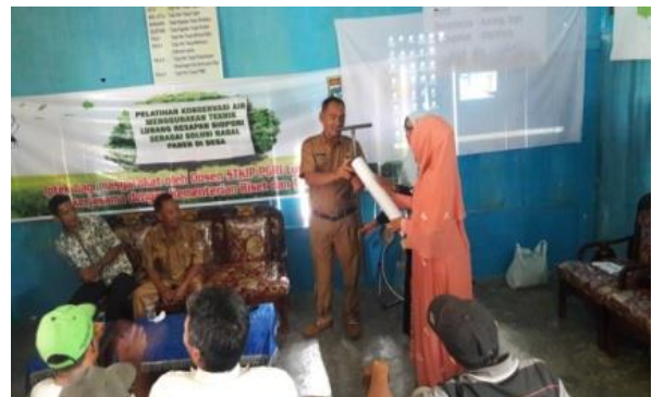
Gambar 6. Penyerahan alat bor biopori beserta pipa LRB secara simbolis

Tim pengabdian masyarakat yang telah bekerja sama dengan Kementerian Riset dan Teknologi Pendidikan Tinggi (Kemenristekdikti) memberikan pipa dan alat bor biopori sebanyak 80 buah kepada mitra.