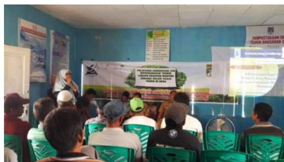
Gambar 1. Pelatihan Pembuatan Teknologi Lubang Resapan Biopori

Salah satu tujuan dari kegiatan ini adalah diberikannya pemahaman atau pengetahuan tentang biopori yang sama sekali belum dikenal oleh warga di Desa Terusan dan Desa Beringin Jaya. Cara yang telah dilakukan yaitu dengan mengumpulkan data pemahaman masyarakat dengan teknik tes berupa tes tertulis. (tes tipe obyektif). Tes tertulis berisi 15 soal dengan pilihan jawaban benar dan salah. Tes bentuk benar-salah soalnya disajikan dalam bentuk pernyataan. Pernyataan tersebut mengandung nilai kebenaran Benar (B) atau salah (S), tetapi tidak keduanya sekaligus. Tes diberikan sebelum dan sesudah dilakukan pelatihan untuk mengetahui peningkatan pemahaman masyarakat tentang teknologi lubang resapan biopori.