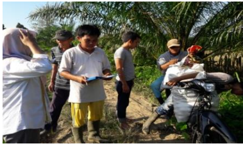
Gambar 4. Tes pemahaman setelah penerapan

Hasilnya menunjukkan bahwa pemahaman masyarakat mengalami peningkatan dari rendah menjadi tinggi, hal ini dapat ditunjukkan pada Gambar 5. sebagai berikut.