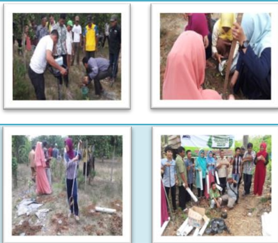
Gambar 7. Penerapan demoplot Lubang Resapan Biopori

Lubang biopori tersebut dibuat berdiameter 15cm dan kedalaman 40-100 cm. Hal ini bertujuan agar fauna tanah dapat mendekomposisi sampah organik yang dimasukkan ke dalam lubang. Setelah lubang selesai dibuat, karena lokasi pembuatan berada di kebun petani jeruk, dan di lokasi tersebut banyak sekali sampah berupa daun-daun tebu kering, buah-buah jeruk yang busuk dan telah jatuh dari pohonnya, serta sampah dapur yang sengaja dibawa oleh warga. Selanjutnya lubang ditutup dengan penutup yang berlubang (dop pipa) untuk tempat masuknya air hujan. Tutup lubang yang digunakan terbuat dari paralon.