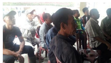
Gambar 3. Warga sedang serius mendengarkan pelatihan LRB

Refleksi dari hasil pelatihan LRB yang telah dilakukan kepada masyarakat menggunakan analisis deskriptif dengan menggunakan skor N-gain. Normalized Gain (N-gain), yaitu selisih antara nilai posttest dengan pretest dibagi dengan selisih antara skor ideal dengan skor pretest , dimana gain menunjukkan peningkatan pemahaman atau penguasaan konsep setelah diberi perlakuan.