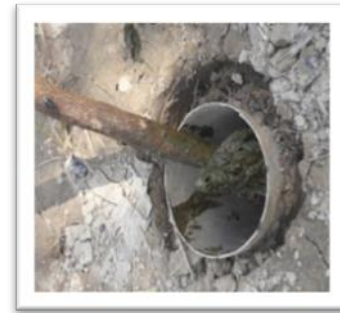
Gambar 8. Hasil timbunan sampah organik dalam Lubang Resapan Biopori

Hasil penerapan IbM ini setelah kurang lebih 24 hari, lubang resapan biopori yang sebelumnya sudah diisi dengan sampah organik, banyak mengalami penyusutan dan ciri-ciri kompos mulai terbentuk (Gambar 8)