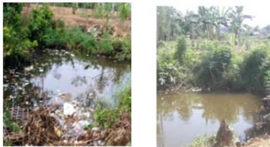
Gambar 2. Kiri (sebelum pembekalan materi) dan kanan (setelah pembekalan materi)

pengabdian masyarakat telah membekali masyarakat dengan materi yang disampaikan yaitu pembekalan tentang gagal panen yang pernah dialami warga yang menyebabkan ada beberapa tanaman seperti cabai, tanaman kacang kuning, jeruk dan lain-lain yang tergenang dan beberapa diantaranya membusuk. Sehingga menyebabkan gagal panen. Dimana salah satu penyebab adanya banjir tersebut yaitu kurangnya menjaga kesehatan lingkungan dan membuang sampah secara sembarangan. Berikut salah satu aktivitas warga yang dapat menyebabkan tingkat kesehatan rendah di desa Beringin Jaya. Serta foto setelah diberikan pembekalan materi tentang menjaga kesehatan lingkungan. (Gambar 2).