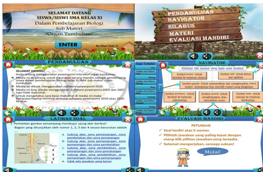
Gambar 1 Tampilan Powerpoint Interaktif Organ Tumbuhan

Media powerpoint interaktif yang dibuat digunakan untuk membantu siswa dalam memahami sub materi organ tumbuhan di kelas XI SMA. Powerpoint yang dibuat ini tidak hanya bersifat audio visual namun juga bersifat interaktif, dimana berisi menu-menu sebagai sistem navigasi, tombol-tombol aktif untuk penjelasan singkat mengenai materi/keterangan gambar, narasi, animasi yang mendukung, video, soal-soal latihan setiap selesai pembahasan materi organ tumbuhan (akar, batang, daun dan bunga), dan evaluasi mandiri (Gambar 1).