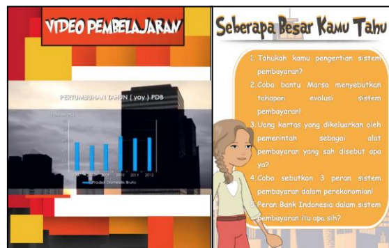
Gambar 4. Video Pembelajaran dan Latihan Soal

Beberapa materi disajikan dengan gambar konkret sebagai pendukung materi yang sedang dibahas. Media pembelajaran ini juga menggunakan beberapa penekanan pada bagian-bagian penting materi seperti penebalan kata, dan pemakaian blank background namun tidak mengurangi unsur karakter tokoh. Tujuan dari penekanan pada bagian-bagian penting dalam pembahasan adalah untuk mempertahankan fokus siswa pada pokok bahasan yang harus dikuasai pada sub bab tersebut. Selain penyajian materi dalam bentuk komik, dalam media pembelajaran komik digital ini juga memuat video pembelajaran dan latihan soal. Tampilan penyajian video pembelajaran dan latihan soal pada gambar 4, sebagai berikut: