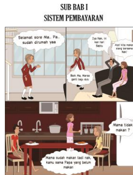
Gambar 2. Tampilan Pembuka Sub BAB 1 Sistem Pembayaran

Tampilan pembuka pada setiap bab diselaraskan yaitu di bagian atas terdapat judul dari sub bab yang akan dibahas pada media pembelajaran komik digital ini terdapat 3 sub bab yaitu sistem pembayaran, alat pembayaran dan sistem dan alat pembayaran non tunai. Contoh penyajian materi pada gambar 3, sebagai berikut: