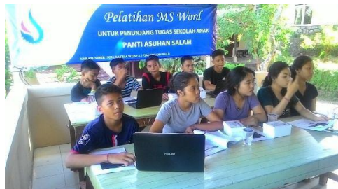
Gambar 3. Pelatihan Microsoft Word Panti Asuhan Salam

Kegiatan pengabdian ini dilakukan dalam tiga tahap dengan persiapan yang dilakukan selama 1 bulan. Diikuti oleh 20 peserta anak panti asuhan. Sisanya tidak dapat mengikuti karena berbarengan dengan kegiatan di sekolah masing-masing. Kegiatan ini dimulai dari sosialisasi ke panti asuhan, pelatihan Microsoft Word , dan evaluasi kegiatan. Dari seluruh kegiatan yang telah dilakukan oleh mitra dan pelatih dapat disimpulkan bahwa kegiatan berjalan dengan baik. Peserta sangat antusias dalam kegiatan pengabdian yang telah dilaksanakan Sosialisasi dilakukan dengan kepala panti asuhan untuk menyampaikan informasi-informasi mengenai latar belakang, target, sasaran dan tujuan pelatihan. Serta membahas mengenai jumlah peserta, waktu, peralatan dan tempat pelatihan.