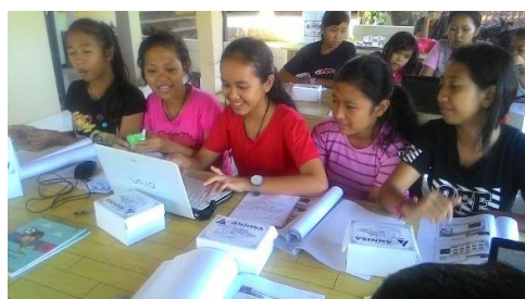
Gambar 4. Pelatihan Microsoft Word Panti Asuhan Salam

Kegiatan yang dilakukan dalam pelatihan ini yaitu mempelajari dasar-dasar penggunaan