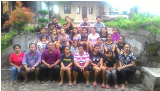
Gambar 2 Sosialisasi ke Panti Asuhan Salam

Tujuan dari kegiatan pengabdian ini selain mengenalkan penggunaan Microsoft Word kepada anak-anak panti di Panti asuhan tersebut adalah untuk mempermudah anak-anak panti asuhan dalam mengerjakan tugas di sekolahnya.