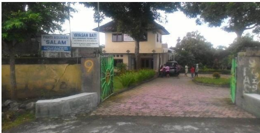
Gambar 1 Panti Asuhan Salam

Selain kendala sarana komputer yang rusak, di panti asuhan ini juga belum pernah diadakan sosialisasi atau pelatihan dalam mengoperasikan Microsoft Word , sehingga anak-anak panti masih awam dalam mengoperasikan Microsoft Word ini. Karena keterbatasan sarana juga, anak-anak panti sangat kurang memperoleh informasi dari luar terutama dari internet kecuali sedikit pengetahuan tentang komputer di sekolah mereka.