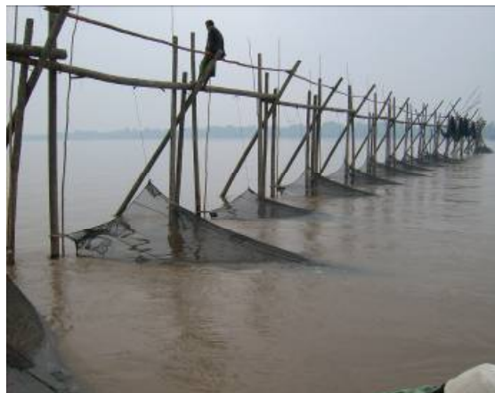
Gambar 2. Unit tuguk baris.

Laju tangkap (hasil tangkapan per satuan alat per waktu) yaitu rata-rata jumlah hasil tangkapan udang dan ikan per jaring per hari seperti disajikan pada Tabel 1. Tabel 1 menunjukkan bahwa kisaran laju tangkap udang antara 1,2-8,2 atau rata-rata 4,84 \pm 2,49 kg per jaring per hari setara dengan 774,40 kg per jaring per tahun dengan komposisi bobot, udang 90,46% dan ikan 9,54%. Dengan asumsi, seluruh jaring tuguk di estuari Sungai Banyuasin (675 jaring), beroperasi