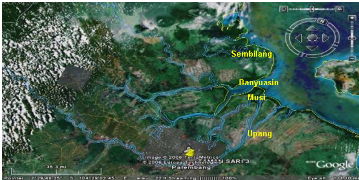
Gambar 1. Lokasi penelitian estuari Sungai Banyuwasin, Kabupaten Banyuwasin, Sumatera Selatan.

tuguk terdiri atas 5-40 unit jaring tuguk yang dimiliki oleh 1 orang atau lebih (berkelompok), tetapi dalam operasionalnya dilakukan secara perorangan.