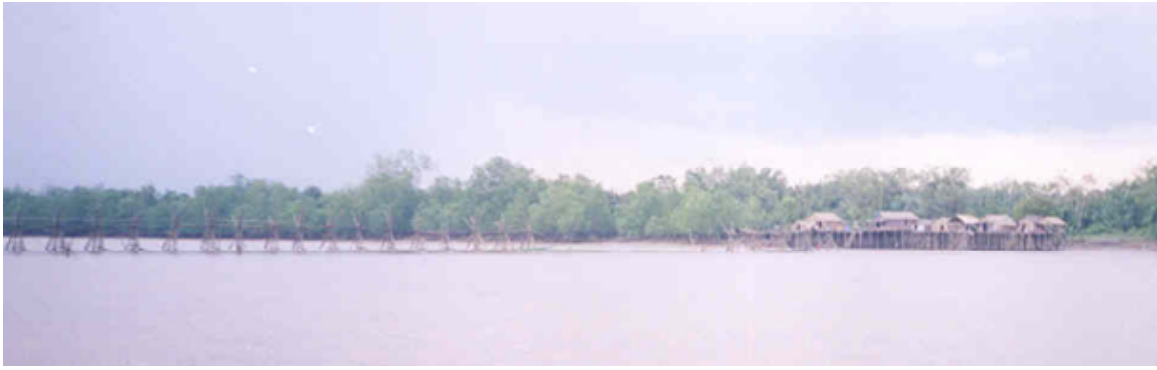
Gambar 5. Pemukiman kelompok nelayan tuguk baris di estuari Sungai Banyuasin.