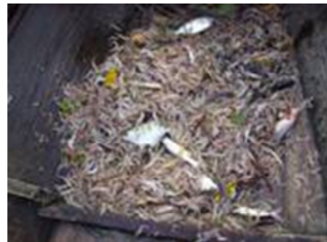
Gambar 4. Ikan dan udang hasil tangkapan tuguk baris.