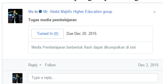
Gambar 3. Tempat pengumpulan tugas di Edmodo

Pemanfaatan SLNs dalam pembelajaran harus didukung infrastruktur teknologi. Hal ini membutuhkan seperangkat komputer dan internet agar SLNs dapat berjalan dengan baik. Guru harus menyiapkan materi yang di upload melalui SLNs sehingga siswa dapat mengakses materi tanpa adanya batasan ruang dan waktu. Materi yang di upload dapat berupa artikel atau teks, gambar, audio, video, dan beberapa bahan ajar lainnya. Moodle dan Edmodo menyediakan fasilitas kepada pengajar untuk mengupload materi. Selain itu, penugasan secara online dapat mengontrol waktu agar siswa tertib dalam pengumpulan tugas.