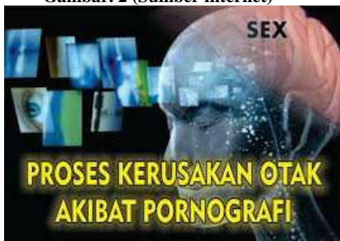
Gambar. 2