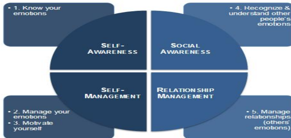
Gambar 2.1 Kecerdasan Emosional Model (Goleman, 2003)

Terdapat beberapa model dalam konseptualisasi kecerdasan emosional antara lain Bar-On Model dan Goleman Model . Bar-On Model berfokus pada susunan kecerdasan emosional dan kecerdasan sosial, sedangkan Goleman Model berfokus kepada kecerdasan emosional.