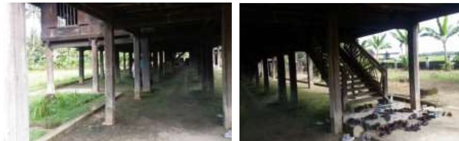
Gambar 6. Kondisi awa bola Saoraja Lapinceng

Dikatakan sebagai kaki rumah karena ruang tanpa dinding ini memiliki jumlah kolom yang banyak sehingga menyerupai seperti kaki. Demikian halnya dengan fungsinya sebagai ruang penggerak dan pendukung segala aktivitas perekonomian penghuninya. Sehingga kolong rumah juga memiliki andil yang cukup besar dalam proses kehidupan yang berlangsung pada Saoraja Lapinceng.