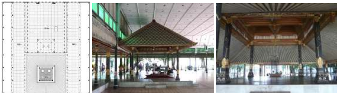
Gambar 3. Selubung Dalam Bangsal Sitinggil-Witono

Selubung dalam (Gambar 3) memperlihatkan keterbukaan dan paduan dua gaya arsitektur (Tradisional Jawa – Eropa).