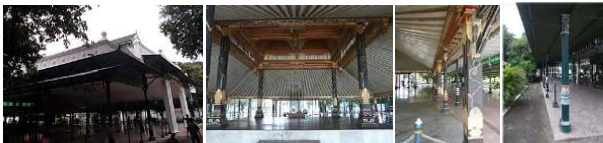
Gambar 4. Struktur Bangunan Bangsal Sitinggil

Struktur bangunan bangsal Sitinggil adalah rangka baja (dengan tiang-tiang beton pada entrance ); struktur bangsal Witono dan bangsal Mangunkur Tangkil berupa rangka kaku kayu - ring balok tumpang sari; struktur bangunan tepi-tepi adalah rangka baja (tiang bundar). Struktur tiap bangunan berperilaku independen terhadap lainnya (aman untuk gaya gempa bumi), dapat dimaknai sebagai toleransi antar tiap bangunan (toleransi budaya Jawa).