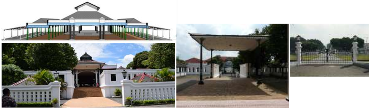
Gambar 5. Elemen Arsitektur Tata Ruang Bangsal Sitihihgil Kiri-bawah: Pagar dan entrance bangsal Sitihihgil. Kiri-atas: Selubung terbuka. Tengah: Pandangan ke Alun-alun dari Bangsal Sitihihgil. Kanan: Gerbang Utara Kraton dan Alun-alun Utara

Elemen signifikan dari gaya arsitektur bangsal Sitihihgil berupa dua gaya arsitektur dalam satu bangunan, yaitu gaya arsitektur Eropa pada bangsal Sitihihgil dan gaya arsitektur Tradisional Jawa pada bangsal Witono-Manguntur Tangkil (Gambar 3), yang dimaknai sebagai toleransi Budaya Jawa.