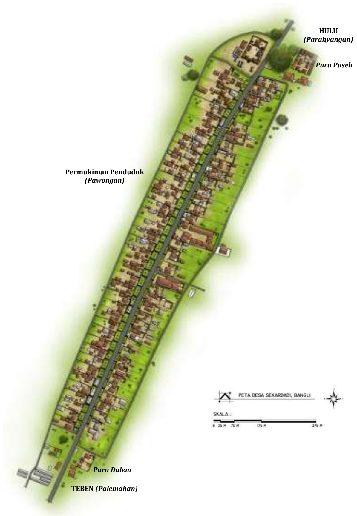
Gambar 2. Pola linier desa merupakan perwujudan dari konsep hulu-teben