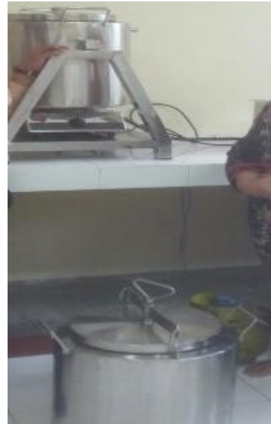
Gambar 6. Pasteurizer dan Inkubator

Proses produksi sudah menggunakan alat pasteurizer yang dilengkapi dengan inkubator yang dapat menampung susu 20 L. Waktu proses produksi adalah 5-6 jam sehingga dalam membuat yoghurt dan kefir plain lebih efisien dan efektif. Menurut [4], lama pemeraman yoghurt dengan menggunakan metode konvensional berlangsung selama 12-18 jam. Alat pasteurizer dan inkubator yang dipakai untuk membuat yoghurt dan kefir disajikan pada Gambar 6.