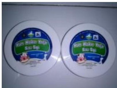
Gambar 5. Masker Kefir Kambing

Proses produksi sudah menggunakan alat pasteurizer yang dilengkapi dengan inkubator yang dapat menampung susu 20 L. Waktu proses produksi adalah 5-6 jam sehingga dalam membuat yoghurt dan kefir plain lebih efisien dan efektif. Menurut [4], lama pemeraman yoghurt dengan menggunakan metode konvensional berlangsung selama 12-18 jam. Alat pasteurizer dan inkubator yang dipakai untuk membuat yoghurt dan kefir disajikan pada Gambar 6.