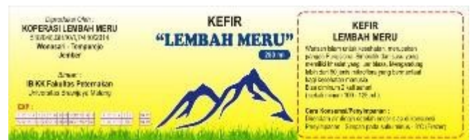
Gambar 7. Label Reseller Kefir binaan IBIKK

IBIKK ini memiliki binaan yang selanjutnya menjadi reseller dari koperasi Lembah Meru, Wonosari, Tempurejo, Jember dengan pemesanan 600 botol kefir ukuran 250 mL per 2 minggu. Label kefir reseller koperasi Lembah Meru disajikan pada Gambar 7.