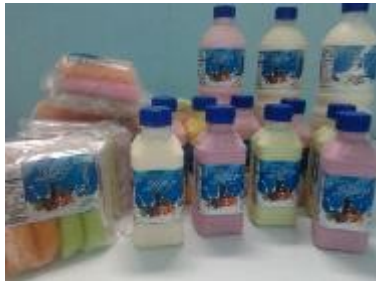
Gambar 3. Yoghurt dan Kefir Drink

Produk IBIKK hanya memproduksi susu fermentasi dari kefir dan yoghurt. Produknya adalah yoghurt drink dan kefir ukuran 250 ml dan 1 L, es lilin ukuran 45 mL, masker krim kefir ukuran 100 g dan face toner kefir 100 mL. Gambar produk-produk IBIKK disajikan pada Gambar 3-5.