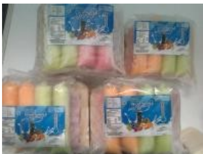
Gambar 4. Es Lilin Yoghurt