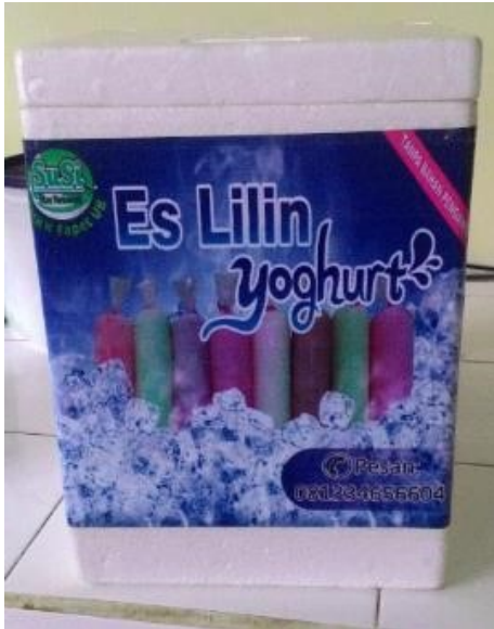
Gambar 8. Alat Pemasaran Es Lilin