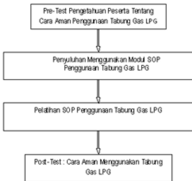
Gambar 1. Langkah Penyuluhan dan Pelatihan

Kegiatan yang dilakukan terdiri dari 3 tahapan utama yang meliputi tahap persiapan yang melakukan proses identifikasi tentang masalah yang ada pada mitra, mengurus proses perizinan, dan melakukan sosialisasi kegiatan kepada tokoh masyarakat dan tokoh agama di wilayah mitra. Selama kegiatan tersebut berlangsung, tim pengabdian secara simultan mempersiapkan modul penyuluhan dan pelatihan. Tahap selanjutnya adalah pelaksanaan melakukan penyuluhan dan pelatihan tentang