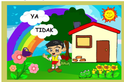
Gambar 1 Tampilan Menu Opening

Gambar di atas adalah tampilan menu opening pada program yang terdiri dari pilihan tombol ya dan tidak .