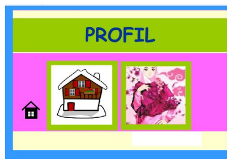
Gambar 6 Tampilan Menu Profil