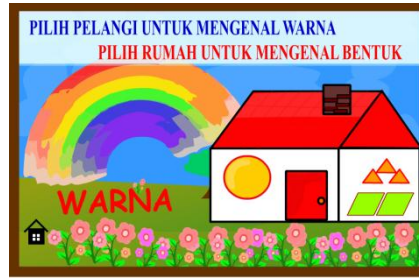
Gambar 4 Menu Pengenalan Warna dan Mengenal Bentuk Geometri