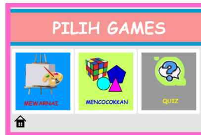
Gambar 5 Tampilan Menu Games

Gambar di atas adalah tampilan menu games , terdapat 3 tombol pilihan games , dan tombol exit .