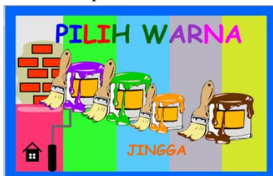
Gambar 3 Menu Mencampur Warna