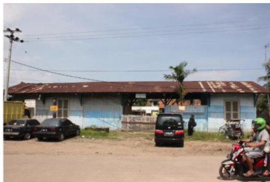
Gambar 3. Halte (Stasiun) Labuan (Dokumen Balai Arkeologi Bandung, 2014)

Halte Saketi terletak di Desa Saketi, Kecamatan Saketi, Kabupaten Pandeglang, pada koordinat 06^{\circ}24'06,76'' LS dan 105^{\circ}59'33,86'' BT dengan ketinggian 108 mdpl. Layanan perkeretaapian yang dilayani meliputi naik turun penumpang dan barang, bongkar muat kereta barang, dan persilangan. Stasiun ini juga dilengkapi dengan rumah dinas untuk kepala dan wakil kepala stasiun. Pada masa pendudukan Jepang, dari Stasiun Saketi dibangun lintas cabang ke Bayah (Pesisir Selatan Banten) sepanjang 83 km yang mulai beroperasi pada tahun 1944. Saat ini, kondisi bangunan masih berdiri dan difungsikan sebagai tempat tinggal keluarga mantan kepala stasiun.