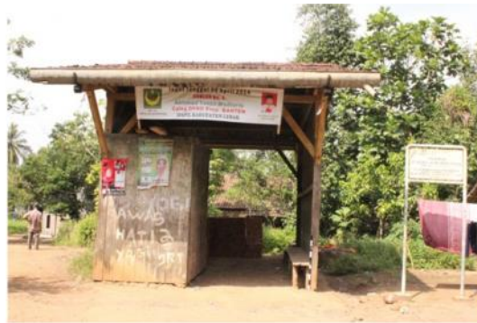
Gambar 4. Bangunan bekas Stopplaast Cibuah

Tingkat pelayanan yang sederhana, yaitu hanya melayani naik turun penumpang dan barang secara terbatas, bangunan stoplaats dibangun sederhana dan berukuran kecil. Bangunan Stopplaats Cibuah berdenah persegi dengan ukuran 5,00 x 4,00 m. Denah bagian dalam bangunan dibagi menjadi dua ruang, yaitu ruang penjualan tiket berukuran 2,00 x 1,80 m. Tiang utama bangunan adalah balok kayu ukuran 12 x 12 cm. Dinding bangunan adalah papan kayu yang dipasang secara horisontal. Atap berbentuk pelana ditutup genteng dan dilengkapi talang air berbahan seng. Pada ruang tunggu dilengkapi dengan satu tempat duduk berbahan papan ukuran 400 cm x 30 cm dan dipasang menempel pada dinding bangunan.