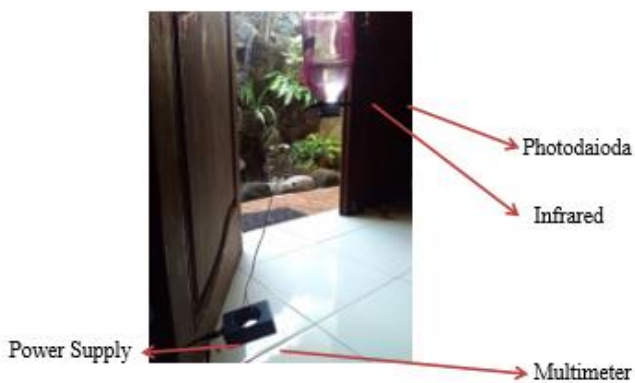
Gambar. 1 Teknik pengumpulan data

Alat dan bahan yang digunakan dalam eksperimen ini yaitu botol kaca infus, cairan NaCl, rangkaian sensor cahaya yang menggunakan photodiode dan receiver infrared.