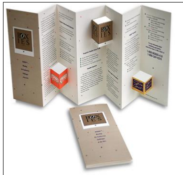
Gambar 2. Box Cut Model