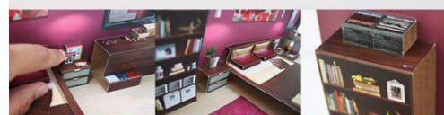
Gambar 5. IKEA catalogue