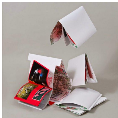
Gambar 1. Cuckoo IV Catalogue, oleh Kolektiv studio

Penulis mencoba merangkum beberapa temuan desain katalog yang termasuk dalam kategori kreatif, melalui penelusuran website.