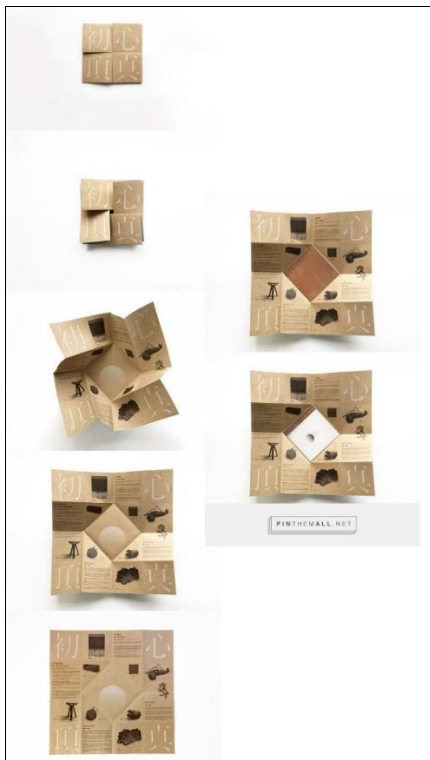
Gambar 4. Custom book charm catalogue