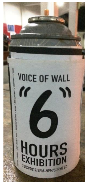
Gambar 6. Katalog Pameran “Voice of Wall 6 Hours Exhibition”.

Analisis yang didapatkan setelah melakukan wawancara dengan beberapa peserta pameran serta pengamatan terhadap katalog pameran “Voice of Wall 6 Hours Exhibition” secara