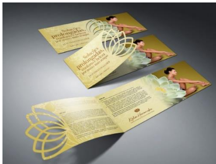
Gambar 3. Katia Haranaka brochure for product catalogue