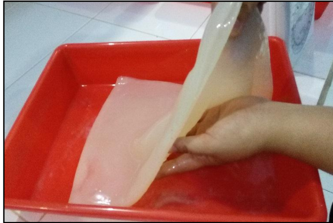
Gambar 1. Formula Nata De Fish Hasil Fermentasi

Loyang yang digunakan sebagai wadah fermentasi nata de fish berukuran 30 cm, nata yang dihasilkan berwarna putih susu dan memiliki aroma tidak sedap berupa amis dan asam yang sangat pekat. Disamping itu, tingginya kandungan protein pada limbah yang digunakan, sehingga pada uji coba perlakuan dilakukan pengenceran dengan air, agar A. xylinum tidak terlalu sulit dalam menghidrolisis limbah yang tinggi akan kadar proteinnya. Terlihat pada Tabel 3, bahwa perlakuan P1C merupakan nata de fish yang terbentuk lebih bagus dibandingkan perlakuan lainnya. Pengenceran yang digunakan yaitu perbandingan air dengan limbah sebesar 1 : 20 atau setara dengan 1 L air bersih dengan 50 mL sari ikan. Kemudian penambahan sumber karbon dengan penambahan gula sebanyak 200 gr, sumber nitrogen dengan penambahan urea sebanyak 5 gr, dan kondisi yang asam dengan penambahan cuka sebanyak 25 mL (Kurniawati et al. 2016).