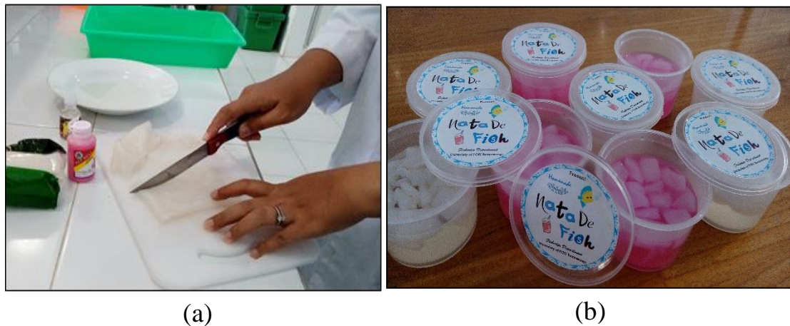
Gambar 3. Pemotongan Nata De Fish (a); Minuman Nata De Fish (b)

Hasil uji proksimat tersaji pada Tabel 4. dan uji deteksi bakteri pathogen diantaranya deteksi Escherichia coli , Staphylococcus aureus , dan Salmonella spp. Tersaji pada Tabel 5. Berikut adalah hasil uji proksimat nata de fish dan uji bakteri pathoden yang telah dilakukan :