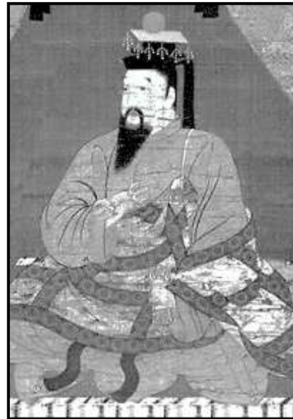
Gambar 2. Ilustrasi Kaisar Go-Daigo

Kaisar Go-Daigo berencana untuk menggulingkan Keshogunan Kamakura pada tahun 1324 dengan bantuan Hino Suketomo (1290-1332) dan Hino Toshimoto (?-1332) (Frédéric, 2002:877). Rencana ini diketahui oleh Rokuhara Tandai dan peristiwa ini dikenal dengan Insiden Shochu ( Shochu no Hen ). Tahun 1331, Go-Daigo kembali menjalankan rencananya untuk menghancurkan Kamakura, tetapi kali ini Go-Daigo kembali dikhianati oleh rekannya, Yoshida Sadafusa (Sansom, 1958:481). Go-Daigo diasingkan di Okino Shima , yang merupakan tempat yang sama dimana Kaisar Go-Toba sebelumnya diasingkan. Akan tetapi, berbeda dengan Go-Toba, tidak lama setelah diasingkan, Go-Daigo berhasil melarikan diri dan menghimpun dukungan di bagian Barat Honshu (Henshall, 2012:40).