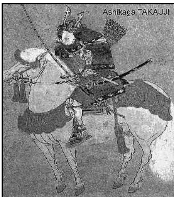
Gambar 4. Ilustrasi Ashikaga Takauji

Pertempuran dimulai pada 1331 dimana Keshogunan memaksa Go-Daigo untuk turun tahta. Pada awalnya, Go-Daigo mengalami kekalahan, sehingga ditangkap dan diasingkan di Okino Shima . Akan tetapi, Bakufu kewalahan dengan prajurit-prajurit koalisi yang dihimpun oleh Go-Daigo dan pada 1332, Go-Daigo berhasil melarikan diri dari pengasingannya. Go-Daigo kembali ke Kyoto dengan kemenangan, tetapi tidak lama kemudian pada 1336, Ashikaga Takauji (1305-1358) yang merupakan panglima Bakufu mengirimkan pasukan untuk menghancurkan Go-Daigo. Nitta Yoshisada (1301-1338) yang merupakan prajurit sekutu Go-Daigo menaklukkan Kamakura dan berhasil mengakhiri kekuasaan Hojo.