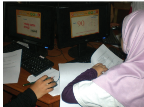
Foto 2. Siswa Menjawab Pertanyaan Evaluasi Pada Multimedia Interaktif

Selain materi yang mudah dipahami, untuk mengukur kemudahan ini juga perlu dilihat kemudahan dalam memahami pertanyaan di dalam evaluasi. 16 orang (64%) mengatakan bahwa mereka dapat memahami pertanyaan pada evaluasi dan 9 orang (36%) mengatakan tidak memahami. Alasan yang mereka berikan untuk jawaban “ya” adalah 10 orang (40%) mengatakan bahwa pertanyaan yang disajikan mudah dan 6 orang (24%) tidak memberikan alasan apa pun. Siswa yang menjawab tidak memberikan alasan bahwa pertanyaan yang disajikan susah-susah gampang. Kemudahan siswa dalam memahami pertanyaan evaluasi ini didukung oleh data observasi bahwa siswa memang dapat menjawab pertanyaan-pertanyaan uji kompetensi evaluasi pembelajaran yang disediakan di dalam multimedia interaktif tersebut.