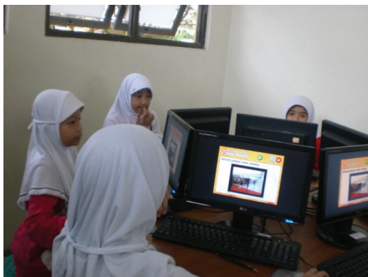
Foto 1. Siswa Asyik dengan Media Masing-Masing (Dokumentasi Dwi Anggraini Tanggal 4 November 2011)

Sebuah media pembelajaran yang baik adalah media yang penyajian materinya mudah dimengerti, dipelajari atau dipahami oleh peserta didik. Hal ini dapat dilihat dari hasil kuesioner bahwa 24 orang (96%) mengatakan bahwa mereka dapat memahami materi dengan baik. 24 orang tersebut memberikan alasan yang berbeda-beda. 6 orang (24%) memberikan alasan bahwa materi yang disajikan jelas dan mudah dipahami karena sudah ada penjelasannya, 4 orang (26%) mengatakan bahwa mereka memang bisa memahaminya, 1 orang (4%) mengatakan bahwa materi yang disajikan dalam multimedia interaktif ini dapat lebih mengontrol otak, 1 orang (4%) mengatakan bahwa materinya gampang-gampang susah, sedangkan yang lainnya hanya menjawab ya, dan tidak memberikan alasan apa-apa. Kemudahan memahami materi ini didukung oleh data observasi bahwa siswa dapat memahami isi materi yang disajikan pada multimedia interaktif baik secara pasif dan aktif. Pasif yang dimaksud adalah siswa terlihat asyik dengan media mereka masing-masing dan aktif adalah siswa mampu menjawab pertanyaan yang diajukan oleh guru.