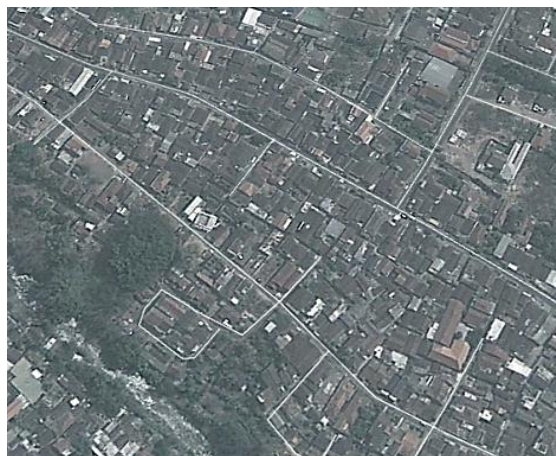
Gambar 1. Kepadatan Permukiman di Kampung Tembalangan

Permasalahan penataan lansekap ini menjadi sangat penting karena terkait dengan kendala lahan yang terbatas, teknik yang harus dikuasai, dan kebutuhan tanaman yang dibudidayakan. Penataan lansekap pada program Kampung Agropreneur ini perlu direncanakan dengan baik agar sekaligus dapat menjadi solusi bagi permasalahan kebutuhan ruang terbuka hijau dan peningkatan kualitas visual dan ekologi.