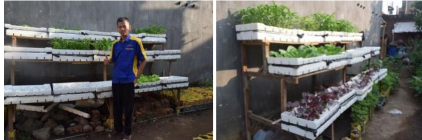
Gambar 9. Hidroponik dapat ditempatkan di halaman, teras, atau ruang yang lain karena lebih praktis