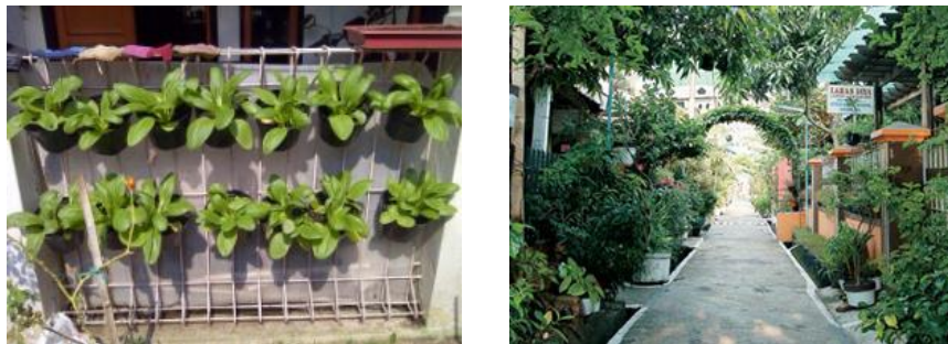
Gambar 10. Contoh gang hijau. Obyek studi perlu lebih banyak dukungan untuk menjadi seperti contoh di atas