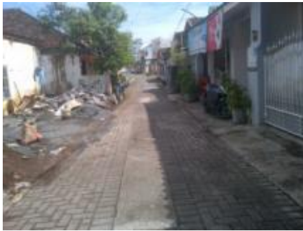
Gambar 4. Jalan kampung ditutup paving, tanaman hijau hanya ada di beberapa titik sehingga jalur sirkulasi ini terasa panas bila siang hari