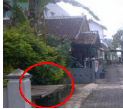
Gambar 3. Adanya lincak/ amben di pinggir jalan menunjukkan kebutuhan masyarakat akan ruang sosial