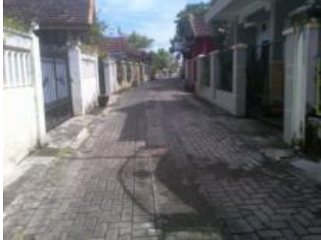
Gambar 2. Ruang terbuka hijau sangat minim