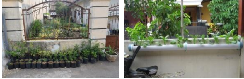
Gambar 8. Pemanfaatan teras untuk berkebun