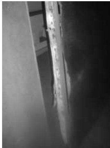
Gambar 3 Struktur lukisan yang rusak karena lembab.