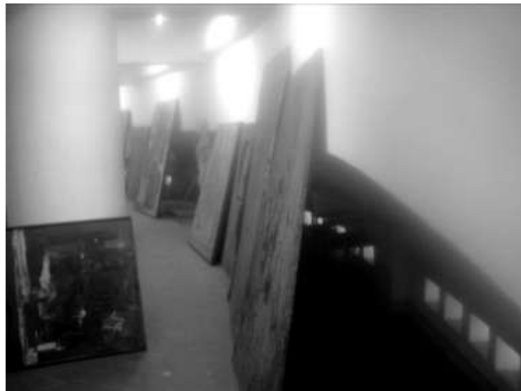
Gambar 1 Penyimpanan koleksi lukisan di ruang Galeri Soemardja.

Sesuai dengan fungsinya tersebut, Galeri Soemardja ITB banyak menyimpan koleksi-koleksi seni di dalamnya, khususnya lukisan. Namun, berdasarkan hasil observasi langsung, sampai saat ini Galeri Soemardja ITB belum memiliki ruangan khusus untuk menyimpan koleksi-koleksi tersebut. Hal tersebut menyebabkan sebagian besar karya dibiarkan tersandar di dinding-dinding selasar Galeri (Gambar.1). Akibatnya, kerusakan-kerusakan yang tak terhindarkan pun terjadi pada hampir sebagian besar koleksi, terutama yang memang sudah berusia relatif tua. Hal yang sama pun terjadi di Studio Seni Lukis FSRD-ITB, dengan mudah ditemukan karya-karya lukis hasil studi mahasiswa yang disimpan atau diletakkan begitu saja, tanpa memperhitungkan faktor keamanan karya.