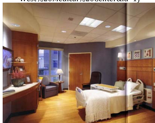
Gambar 3. Foto Kamar Rawat Inap di Clarian West Medical Center

http://healthcaredesignweb.org/HWmem/case/hospital.asp?hospital_id=4&hospital_name=Clarian%20West%20Medical%20Center&id=1 )