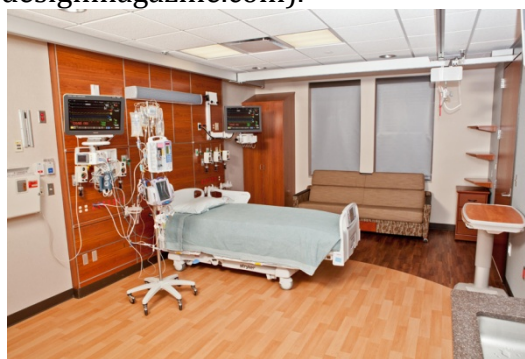
Gambar 1. Acuity Adaptable Care Private Patient Rooms

Penjelasan lebih detail tentang Kamar Pasien di Rumah Sakit Jantung Sanford: Rumah Sakit Jantung Sanford, memiliki tampilan digital untuk menyampaikan pesan dan memberikan informasi yang penting untuk menghasilkan pelayanan yang bersih dan terkonsolidasi. Peralatan keselamatan yang state-of-the-art disediakan untuk membantu staf dan menyediakan cara yang aman bagi pasien untuk bergerak di dalam kamar mereka. Lift plafon menyediakan cara yang aman bagi pasien untuk bergerak dari tempat tidur mereka ke kamar mandi tanpa melelahkan staf. Kamar mandi memiliki pintu selebar 42 inch, grab bar ( railing genggam), showers untuk kursi roda, dan pencahayaan yang diaktifkan dengan gerakan yang semuanya memberikan rasa aman kepada pasien serta menjamin keselamatan dan keamanan. Laci pengiriman khusus disediakan di dinding luar kamar pasien untuk memungkinkan karyawan apotek memberikan obat dan bahan lainnya tanpa harus mengganggu waktu istirahat pasien. Kotak air dialisis juga dirancang dengan koneksi yang mudah ke sumber air yang diperuntukkan bagi pasien yang membutuhkan dialisis selama mereka tinggal. Seni dan musik telah lama dikenal untuk menghibur dan menenangkan jiwa dan tubuh manusia. Seni juga ditemukan meningkatkan kecepatan pemulihan dan juga mendukung perjuangan pasien dan keluarga. ( http://www.healthcaredesignmagazine.com ).