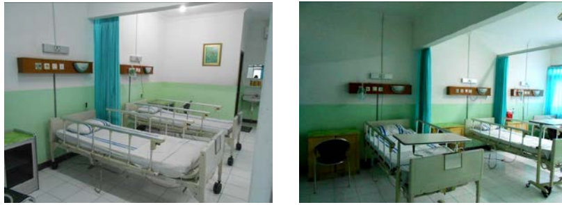
Gambar 4. Foto Ruang Rawat Inap Kelas II dan III di Paviliun RS X

Dilakukan wawancara dengan keluarga pasien yang tinggal di Paviliun Jantung ini. Karena sifat penelitian ini yang bersifat eksploratif maka disusun pertanyaan yang bersifat eksploratif yang terutama terkait dengan ukuran ruang dan warna ruangan (dibatasi dahulu pada 2 aspek), walaupun telah diketahui terdapat faktor-faktor kualitas ruang lainnya dari Anderson (2008), Hatmoko et al (2010) dan Novak & Richardson (2012). Responden sebanyak 5 orang keluarga pasien dari Kelas II dan Kelas III. Jumlah ini diambil karena keterbatasan waktu survei karena perijinan dari Rumah Sakit.