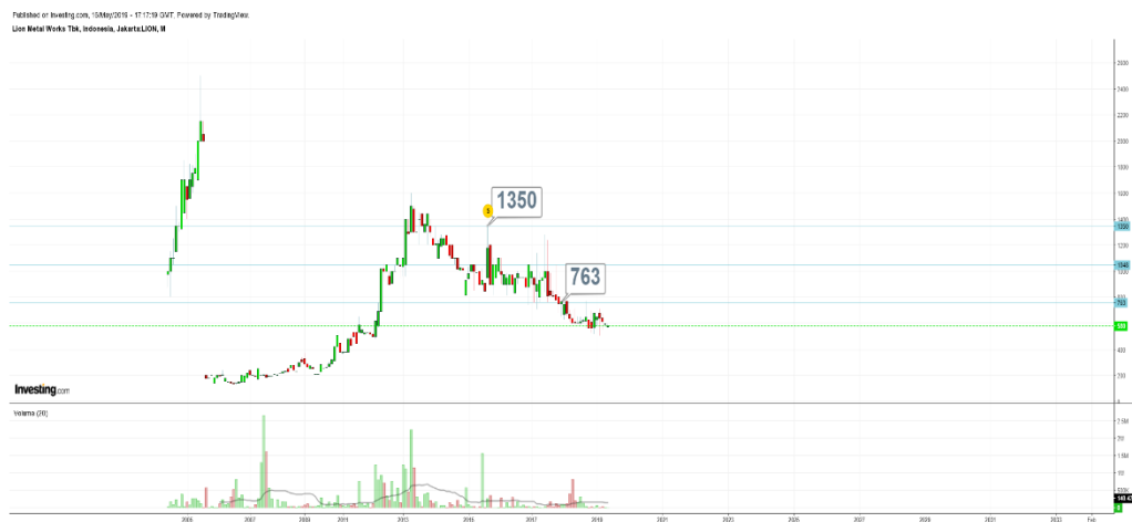
Gambar 1. Grafik harga saham

PT. Lion Metal Work Tbk terdaftar pada BEI dengan kode saham LION yang bergerak pada bidang pembuatan alat kantor dari baja, peralatan gudang, bahan bangunan dan peralatan rumah sakit. Pada saat ini berupaya memperbaiki kinerjanya, melakukan efisiensi, dan peningkatan produktivitas dari tahun pertahun. Berikut adalah grafik yang menggambarkan kondisi harga saham PT. Lion Metal Work Tbk yang mengalami penurunan pada tiap tahunnya.