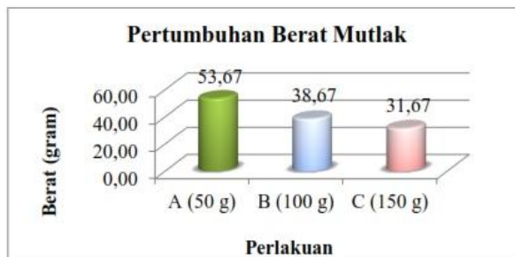
Gambar 1 Grafik Pertumbuhan Berat Mutlak Bibit Alga Laut

Pertumbuhan berat mutlak alga laut ( Kappaphycus alvarezii ) selama 42 hari pemeliharaan disajikan pada Gambar 1 berikut: