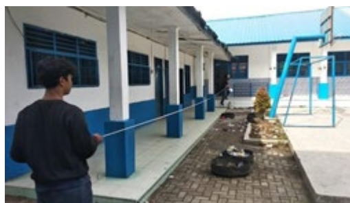
Gambar 3.2. Pengukuran Luas Permukaan Tanah Yang Tertutupi Oleh Bangunan