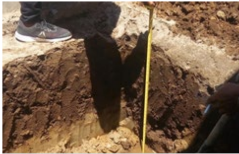
Gambar 3.3. Proses Penggalian Sumur Resapan Air Hujan