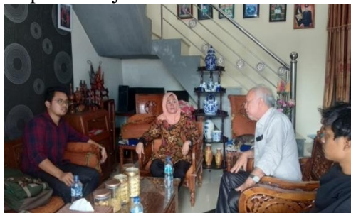
Gambar 3.1. Rapat Tim Pengabdian Masyarakat Dengan Koordinator Masyarakat Setempat

Gambar-gambar berikut merupakan dokumentasi pelaksanaan pengabdian kepada masyarakat dari awal kegiatan yaitu rapat koordinasi dengan masyarakat setempat sampai dengan tahap pembangunan sumur resapan air hujan.