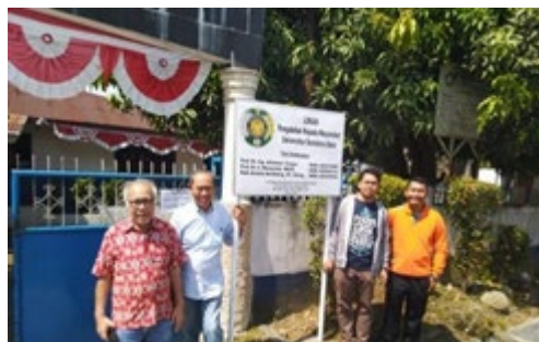
Gambar 3.5. Tim Pengabdian Bersama Dengan Perwakilan Dari Masyarakat