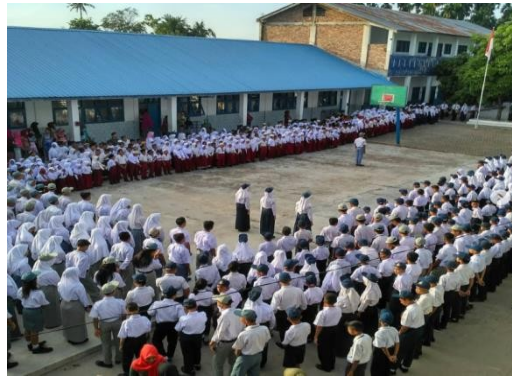
Gambar 1.1. Kondisi Lahan Yayasan Perguruan Gusti Wijaya

Pada Gambar 1. terlihat lahan yayasan hampir seluruhnya tertutup dengan gedung dan halamannya tertutup oleh beton dan paving block. Hal ini menyebabkan besar infiltrasi menjadi berkurang ketika hujan, sehingga memperbesar limpasan permukaan.