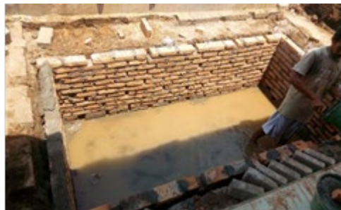
Gambar 3.4. Pemasangan Dinding Sumur Resapan Air Hujan