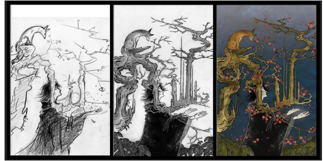
Gambar 1. Proses ilustrasi Yuko Shimizu

Dalam bukunya The DC Comics Guide to Digitally Drawing Comics , Freddie E Williams menyatakan bahwa kita bisa saja sepenuhnya meninggalkan pensil dan kertas fisik dan mulai membuat komik secara digital dengan media komputer sejak awal proses sketsa sampai pada finalisasinya (Williams, 2009:9). Walaupun demikian pada kenyataannya banyak ilustrator komik tetap memilih menggunakan media konvensional, misalnya Alex Ross yang mengerjakan karyanya sepenuhnya dengan cat air.