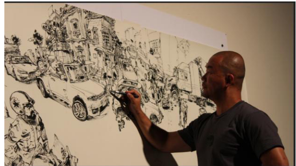
Gambar 2. Ilustrator Kim Jung Gi menggambar di kertas berukuran besar

dengan media tradisional. Jarak antara seniman dengan bidang kerjanya, gerak maju mundur memberikan dampak psikologis yang berbeda. Memahami ukuran karya secara nyata tentu diperlukan dalam proses pembelajaran tahap awal.