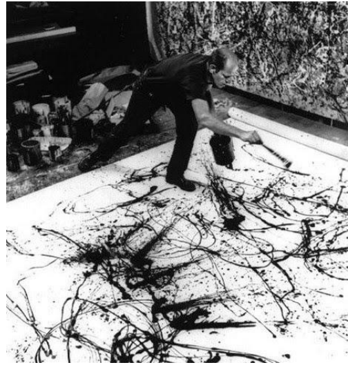
Gambar 4. Ekspresi dan teknik melukis Jackson Pollock

memberikan inspirasi dan eksplorasi ekspresi. (Mendelowitz, 2007:349)