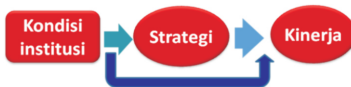
Gambar 1. Kerangka Pemikiran

Kerangka teoritik penelitian ditunjukkan pada Gambar 1. Institusi sebagai variabel eksogen mempengaruhi strategi BUMN. Strategi BUMN sebagai variabel endogen sekaligus variabel mediator mempengaruhi kinerja BUMN. Institusi secara langsung mempengaruhi kinerja BUMN.