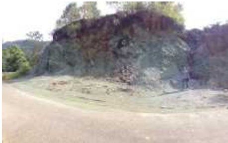
Gambar 2. Lereng Gunung Singgah Mata

Batuan metamorf di Gunung Singgah Mata memiliki kadar Nephrit dan Jadiete yang tinggi, sehingga menimbulkan komposisi warna hijau yang terlihat jelas pada lereng Gunung.