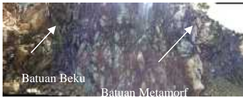
Gambar 1. Bukti Jalur Melance

Gunung Singgah Mata, Kecamatan Beutong, Kabupaten Nagan Raya, tempat terdapatnya batu giok, merupakan peGunungan yang terletak di kawasan perbatasan kabupaten Nagan Raya dan Aceh Tengah provinsi Aceh. Di peGunungan Singgah Mata terdapat jalur melance atau pertemuan besar batuan metamorf dan batuan beku. Hal ini dapat dilihat dengan ditemukannya jenis batuan metamorf dan batuan beku dalam suatu lokasi yang tidak berjauhan.