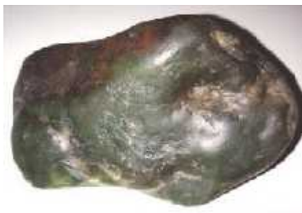
Gambar 6. Giok Vesuvianit Beutong