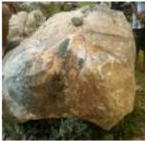
Gambar 4. Giok Jadiet Beutong

2. Nephrit. Nephrit adalah mineral yang termasuk kedalam kelompok mineral Amphibole atau sering disebut kelompok mineral Tremolite, dengan rumus kimia Ca(Mg,Fe)_5Si_8O_{22}(OH)_2 dan merupakan salah satu mineral penyusun batu giok selain Jadiet. Nephrit sedikit lebih kuat dibanding Jadiet dalam hal ketahanan/kekerasan, dan permukaannya sedikit lebih halus. Nephrit memiliki sistem kristal monoklinik dengan kekerasan 6,5-7 Mohs, dan berat jenis 2,95 \text{ gr/cm}^3 , lebih rendah dibandingkan Jadiet. Nephrit dibentuk dalam batuan Metamorf dibawah suhu yang relatif rendah dengan tekanan yang tinggi. Albit ( NaAlSi_3O_8 ) adalah mineral umum penyusun kulit bumi, dan memiliki berat jenis yang lebih rendah dari Nephrit yaitu 2,6 \text{ gr/cm}^3 . Dengan meningkatnya tekanan, Albit tertimbun kebawah, dan pada tekanan yang tinggi membentuk mineral Nephrit.