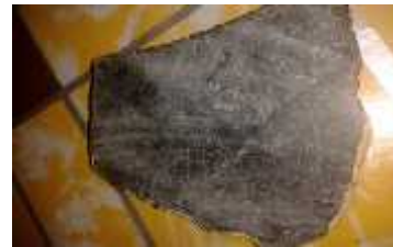
Gambar 5. Giok Serpentin Beutong

Berikut adalah daftar mineral tersebut: Serpentin Mg_6Si_4O_{10}(OH)_8 sistem kristal monoklinik, Antigorite (Mg,Fe)_3Si_2O_5(OH)_4 sistem kristal monoklinik, Clinochrysotile Mg_3Si_2O_5(OH)_4 Sistem kristal monoklinik, Lizardite Mg_3Si_2O_5(OH)_4 Sistem kristal trigonal dan heksagonal, Orthochrysotile Mg_3Si_2O_5(OH)_4 Sitem kristal ortorombik, Parachrysotile (Mg,Fe)_3Si_2O_5(OH)_4 Sitem krsital ortorombik. Serpentin memliki sistem kristal monoklinik dengan kekerasan 2,5-5,5 Mohs, dan berat jenis 2,44-2,62 \text{ gr/cm}^3 .