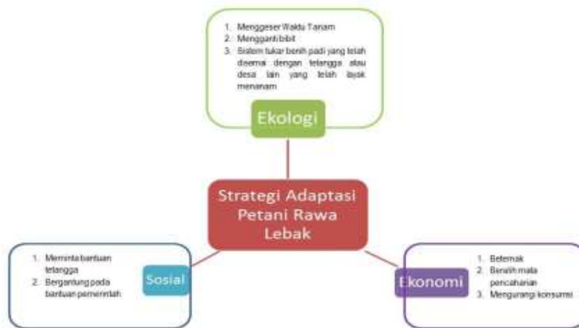
Gambar 3. Strategi Adaptasi Petani Rawa Lebak dalam Menghadapi Perubahan Iklim