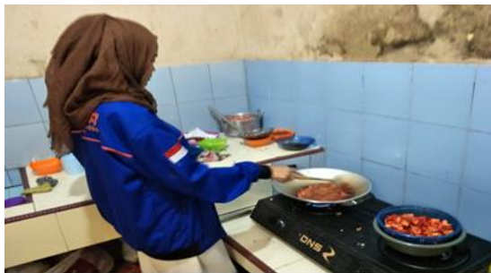
Gambar 4. Proses Penggorengan Kulit Melinjo