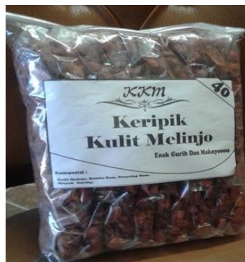
Gambar 7. Produk Keripik Kulit Melinjo 40

Pemasaran offline adalah sebuah usaha untuk memperkenalkan bisnis atau produk yang akan dijual kepada masyarakat luas. Pada tahap pemasaran offline yang dilakukan yaitu dengan cara menitipkan produk kepada warung-warung sekitar di Desa Tamiang. Pada awal strategi pemasaran offline yang dilakukan yaitu dengan menitipkan produk pada tiga warung. Pemasaran ini produk yang telah laku terjual yaitu sebanyak 3 pak. Strategi pemasaran offline ini akan ditingkatkan ke depannya untuk lebih banyak menitipkan produk ke warung-warung lainnya.