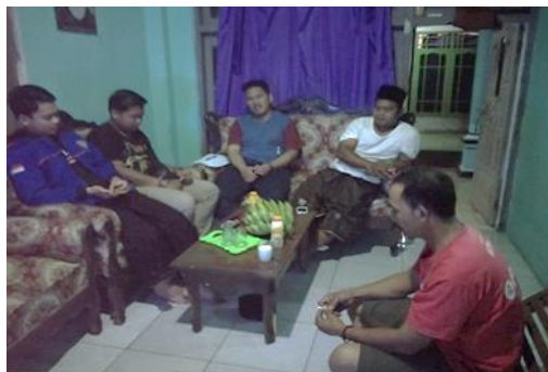
Gambar 2. Diskusi dengan Ketua RT di Kampung Cilebak

Melihat potensi yang ada, tim menyampaikan kepada ketua RT dan tokoh masyarakat mengenai rencana kegiatan penyuluhan dan pelatihan dalam pembuatan keripik kulit melinjo. Usulan ini disambut dengan baik oleh ketua RT, tokoh masyarakat dan juga warga.