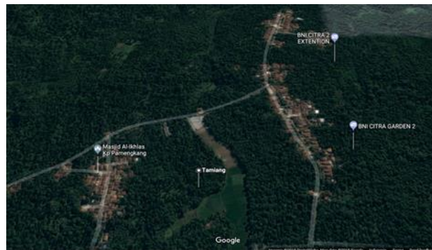
Gambar 1. Lokasi Desa Tamiang Gunung Sari Serang

Kampung Cilebak terletak di Desa Tamiang, Kecamatan Gunung Sari Serang. Nama Desa Tamiang diambil dari suatu bukit yang bernama pasir Tamiang yang bertujuan supaya desa bisa menjadi pelindung dan pengayom bagi masyarakatnya. Desa Tamiang berbatasan sebelah Utara dengan Desa Cokop Sulanjana, sebelah Selatan berbatasan dengan Desa Gunungsari, sebelah Barat berbatasan dengan Desa Sukalaba, dan sebelah Timur berbatasan dengan Kelurahan Cibendung.