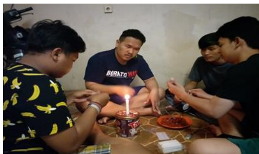
Gambar 5. Pengemasan Menggunakan Peralatan Sederhana