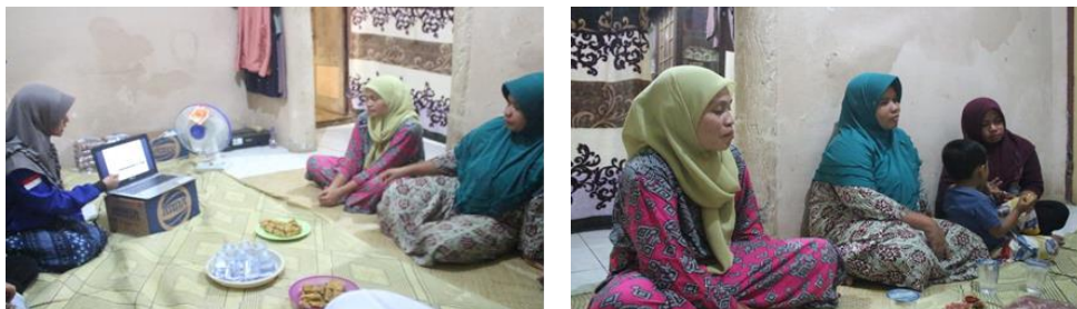
Gambar 3. Penyuluhan Pengolahan Keripik Kulit Melinjo

Kegiatan selanjutnya adalah persiapan dan sosialisasi ke warga masyarakat. Kegiatan penyuluhan dilaksanakan pada hari Selasa tanggal 10 Desember 2018 bertempat di rumah warga.