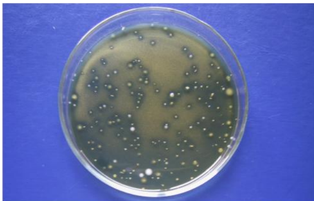
Prima doc 200

Screening bakteri asam laktat proteolitik. Screening bakteri asam laktat proteolitik diawali dengan isolasi bakteri asam laktat. Dari total 180 koloni bakteri yang memberikan zona jernih pada medium MRS dan \text{CaCO}_3 , didapatkan sebanyak 150 isolat yang menunjukkan ciri bakteri asam laktat yaitu masing-masing 42 isolat dari bekasam nila, 53 isolat dari bekasam bandeng, dan 55 isolat dari bekasam tuna. Contoh isolat penghasil zona jernih pada medium MRS dan \text{CaCO}_3 seperti Gambar 1. Terhadap seluruh isolat bakteri asam laktat selanjutnya dilakukan pengujian bakteri asam laktat yang mempunyai aktivitas proteolitik yang ditunjukkan