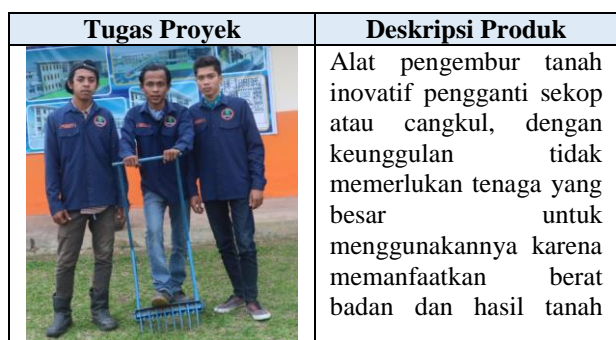
Tabel 1. Hasil Tugas Proyek Mahasiswa

Kegiatan pembelajaran yang terakhir adalah presentasi laporan tugas proyek yang dilaksanakan pada pertemuan ke-18. Kemampuan akhir yang diharapkan dari kegiatan pembelajaran ini adalah Mahasiswa mampu mengkomunikasikan dengan mempresentasikan laporan tugas proyek dalam bentuk seminar kelas. Hasil produk mahasiswa dapat dilihat pada tabel 1.