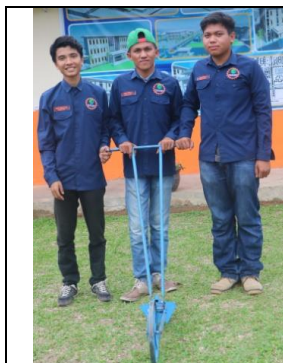
Kultivator Lister Manual

Kultivator lister manual adalah alat untuk kultivasi tanaman berjarak, dengan cara kerja didorong secara manual, kemudian piringan bajak yang dipasang mendorong tanah kearah tanaman.