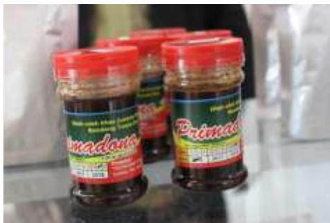
Gambar 4. Petis Bandeng dari UKM Primadona