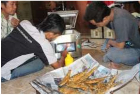
Gambar 2. Penyuluhan alat menggunakan Vacuum Sealer untuk UKM Kembar Sumber Rejeki

Gambar 2 merupakan proses penyuluhan yang kami lakukan untuk UKM Kembar sumber rejeki, yaitu penyuluhan menggunakan vacum sealer. Hal ini bertujuan agar produk yang dihasilkan lebih awet, sehingga kualitas lebih bagus dan penjualan semakin meningkat. Selain itu kami juga melakukan penyuluhan terkait dengan Standard Operasional Prosedur (SOP) dari UKM kembar sumber rejeki.