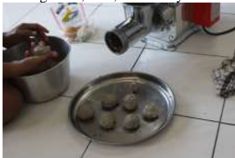
Gambar 3. Penyuluhan pembuatan bakso bandeng untuk UKM Primadona