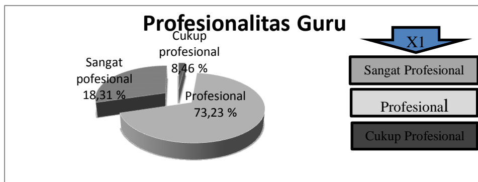
Gambar 2. Deskripsi Persentase Profesionalitas Guru Sekolah Dasar di Kecamatan Palu Timur

Variabel motivasi guru butir instrumen penelitian sebanyak 25 butir pertanyaan dengan 5 pilihan, sehingga skor butir dapat ditentukan sebagai berikut, Skor tertinggi 5 \times 15 = 75 , Skor terendah 1 \times 15 = 15 , Range = 60, Interval Kelas = 60 : 5 = 12 .