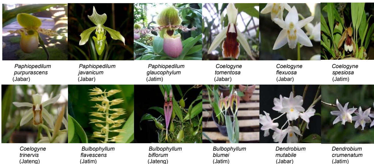
Gambar 1. Bahan tanaman 12 anggrek asal Jawa Tengah, Jawa Timur dan Jawa Barat.

Bermawie (2005) menyatakan bahwa karakterisasi merupakan suatu kegiatan dalam konservasi plasma nutfah untuk mengetahui sifat morfologi yang dapat dimanfaatkan dalam membedakan antaraksesi, menilai besarnya keragaman genetik, mengidentifikasi varietas menilai jumlah aksesi dan sebagainya. Batang anggrek diamati berdasarkan tipe pertumbuhan. Ada 2 tipe pertumbuhan anggrek yaitu monopodial dan simpodial. Batang monopodial merupakan batang yang memanjang ke atas dan hanya terdapat satu batang, sedangkan batang simpodial merupakan batang ke