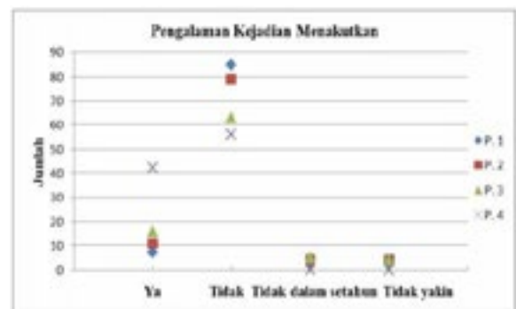
Gambar 2 Pengalaman Kejadian Menakutkan

Berdasarkan faktor risiko serta jenis/karakteristik kekerasan terhadap anak khususnya di tingkat keluarga terbanyak adalah pernah melihat orang dewasa di rumah meneriaki dan berteriak yang membuat takut. Berdasarkan jenis pengalaman disiplin dan mendapatkan tindak kekerasan untuk persentase terbanyak yang pernah terjadi adalah memberi sesuatu istimewa atau uang yaitu 89 orang (90.82%), menyuruh melakukan sesuatu untuk mengubah perilaku yaitu 84 orang (85.7%), menjelaskan bahwa yang dilakukan adalah salah yaitu 81 orang (82.7%).