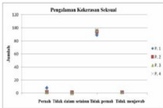
Gambar 3 Pengalaman Kekerasan Seksual