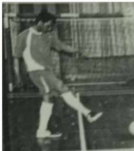
Gambar 3 Sikap Akhir

Pada sikap akhir saat bola sudah lepas dari kaki upayakan posisi kaki mengikuti arah bola hingga tiba disasaran seperti gambar 3 (Andri, 2009).