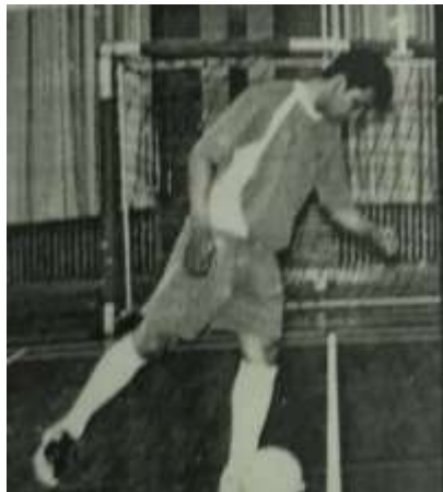
Gambar 1 Sikap Awalan Passing Futsal

Setiap pemain yang akan melakukan passing harus melakukan sikap awalan yang dapat menunjang gerakan serta tendangan atau passing tersebut dapat dilakukan dengan baik sehingga dapat terarah pada sasaran atau teman satu tim. Hal yang harus dilakukan yaitu sebagai berikut: (1) mengaturposisi tubuh; (2) mencondongkan badan sedikit ke depan; (3) posisi kaki sudah anjang-ancang mengayunkan kaki ke belakang. Adapun contoh gambar dari gerakan tersebut disajikan pada gambar 1 (Andri, 2009).