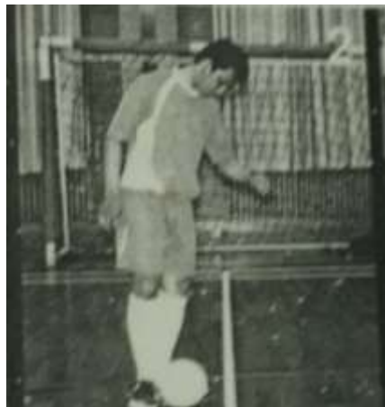
Gambar 2 Sikap Perkenaan Bola

Dalam posisi ini seorang pemain futsal harus melakukan gerakan sebagai berikut: (1) pada saat perkenaan bola, penerima harus dalam keadaan siap dengan badan sedikit condong ke depan; (2) pastikan kaki yang terkena bola adalah tepat kaki bagian dalam; (3) sambil memperhatikan bola dahulu, lalu ayunkan kaki ke arah depan atau ke arah rekan. Adapun contoh gambar dari gerakan tersebut disajikan pada gambar 2 (Andri, 2009).