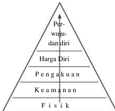
Piramida Kebutuhan menurut Teori Maslow

Setiap individu wajib terpenuhi kebutuhannya yang paling dasar (sandang dan pangan), sebelum ia mampu merasakan kebutuhan yang lebih tinggi sebagai penyempurnaan kebutuhan dasar tadi, yakni kebutuhan keamanan, penghargaan, harga diri, dan aktualisasi dirinya. Bilamana kebutuhan paling dasar yakni kebutuhan fisik berupa sandang, pangan, dan papan belum terpenuhi, maka setiap individu belum membutuhkan atau merasakan apa yang dinamakan sebagai harga diri. Setelah kebutuhan dasar itu terpenuhi, maka setiap individu perlu rasa aman jauh dari rasa takut, kecemasan, dan kekhawatiran akan keselamatan dirinya, sebab ketidakamanan hanya akan melahirkan kecemasan yang berkepanjangan. Kemudian kalau rasa aman telah terpenuhi, maka setiap individu butuh penghargaan terhadap hak azasi dirinya yang diakui oleh setiap individu di luar dirinya. Jika kesemuanya itu terpenuhi barulah individu itu merasakan mempunyai harga diri. Dalam kaitan ini, tentunya pendidikan orang dewasa yang memiliki harga diri dan jati dirinya membutuhkan pengakuan, dan itu akan sangat berpengaruh dalam proses belajarnya. Secara psikologis, dengan mengetahui kebutuhan orang dewasa sebagai peserta kegiatan pendidikan/pelatihan, maka akan dapat dengan mudah dan dapat ditentukan kondisi belajar yang harus diciptakan, isi materi apa yang harus diberikan, strategi, teknik serta metode apa yang cocok digunakan.