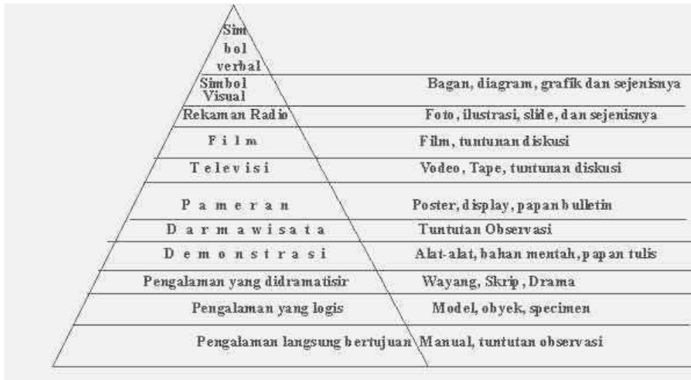
Gambar 2 Kerucut Pengalaman Edgar Dale