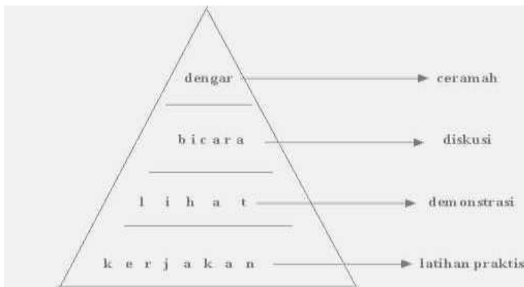
Gambar 4 Piramida Belajar Orang Dewasa

Sejalan dengan itu, orang dewasa belajar lebih efektif apabila ia dapat mendengarkan dan berbicara. Lebih baik lagi kalau di samping itu ia dapat melihat pula, dan makin efektif lagi kalau dapat juga mengerjakan. Komposisi kemampuan tersebut dapat dilukiskan ke dalam piramida belajar ( pyramida of learning ) seperti terlihat dalam Gambar 4 di bawah ini: