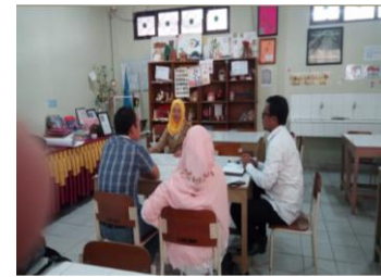
Gambar 2. Tahapan pelaksanaan Lesson study