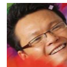
Gambar 1. Ekspresi Bahagia

Dalam pertunjukan sulap klasik yang ditampilkan oleh "Ray Antylogic" terdapat beberapa ekspresi wajah yang paling dominan, yaitu :