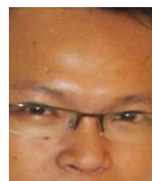
Gambar 7. Kontak mata atau pergerakan mata

Dalam pertunjukan sulap klasik ini juga "Ray Antylogic" menampilkan beberapa kontak mata atau pergerakan mata di wajah "Ray Antylogic" yaitu :