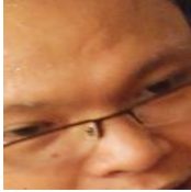
Gambar 8. Kontak mata atau pergerakan mata

Pada gambar 8. pergerakan mata ke atas dan ke kiri hal tersebut dapat diartikan sang pesulap sedang mencoba membayangkan sesuatu yang terjadi sebelumnya. Hal ini dapat menggambarkan bahwa pertunjukan sulap klasik adalah satu kesatuan dari semua permainan sulap klasik dalam pertunjukan tersebut. Sang pesulap tidak hanya memikirkan bagaimana pesan kinesik tersebut disampaikan namun juga bagaimana kinesik itu sendiri dapat dimengerti dengan mudah oleh penonton. Memikirkan bagaimana reaksi penonton dalam permainan sebelumnya dapat menjadi acuan untuk permainan selanjutnya.