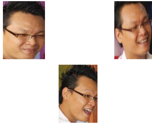
Gambar 4. Senyum Simpul

Dalam pertunjukan sulap klasik ini juga "Ray Antylogic" menampilkan ketiga ekspresi senyuman di wajah yaitu :