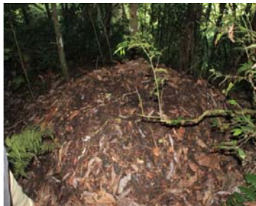
Gambar 1. Contoh sarang Maleo gunung di Kampung Sigim

Bahan penyusun sarang akan diidentifikasi dengan cara mengumpulkan bahan penyusun sarang di setiap sarang yang diamati melalui pengambilan sampel bahan secara acak di sarang. Analisa vegetasi akan dilakukan pada lokasi sarang untuk mendapatkan gambaran komposisi bahan penyusun sarang kemudian bahan penyusun sarang akan di timbang dan dipersentasikan berdasarkan berat awal secara keseluruhan.